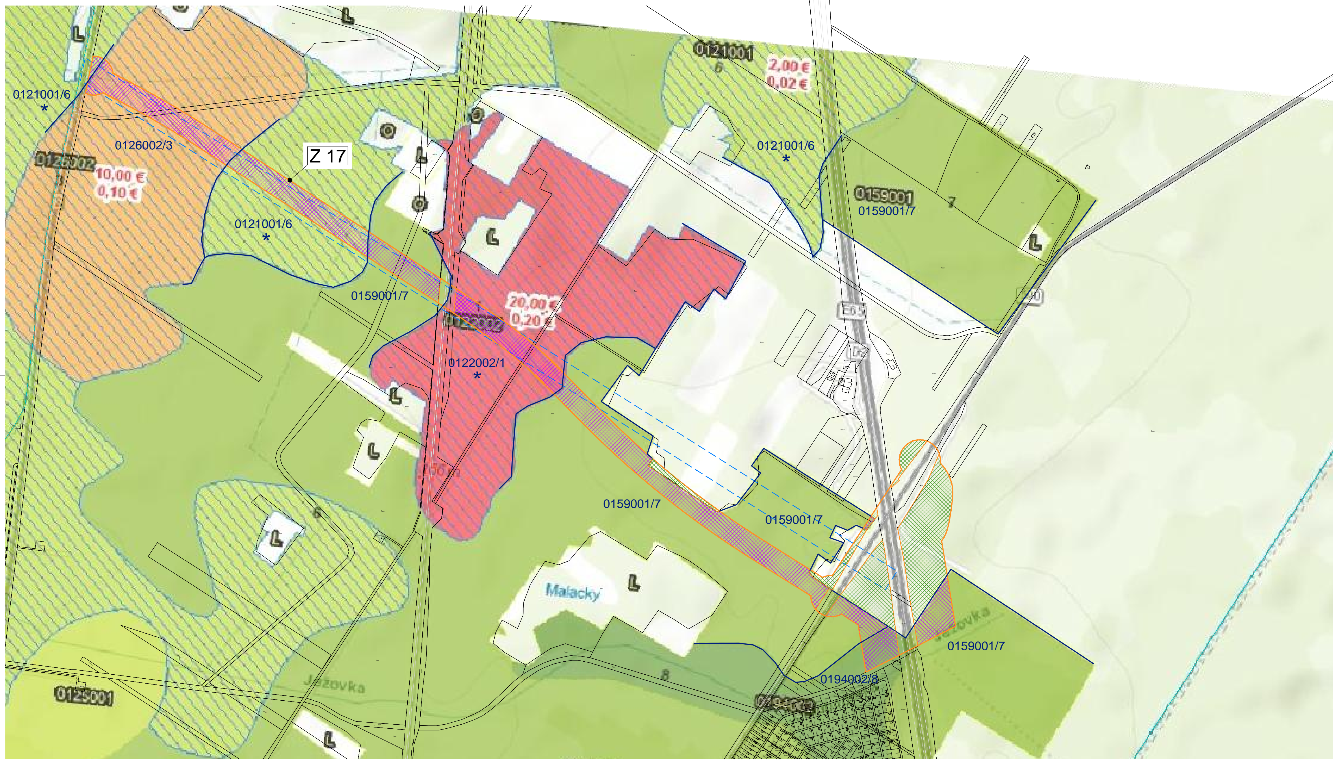
Plošné bilancie lokalít ZaD č.11 pre zábery poľnohospodárskej pôdy