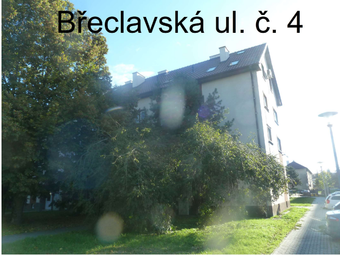
Břeclavská ul. č. 4