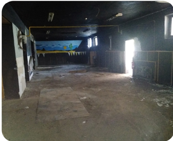
pôvodný stav nájomného priestoru pred rekonštrukciou