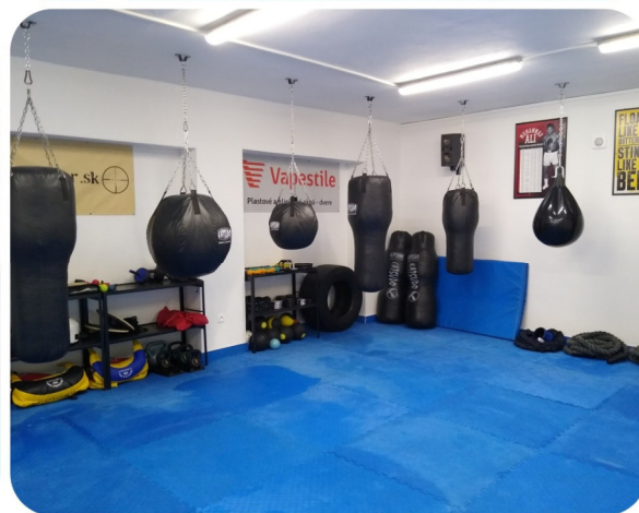
stav nájomného priestoru po rekonštrukcii