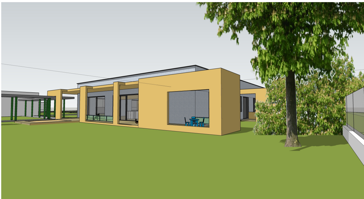
Obrázky 1 a 2: Navrhované architektonické riešenie nového zariadenia.