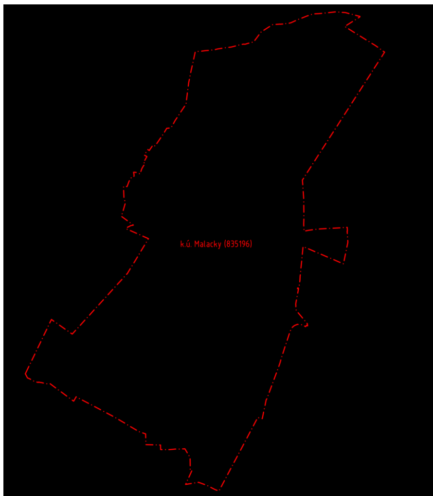
Mapa č. 2: k.ú. Malacky (835196)

Riešené územie ohraničuje hranica katastrálneho územia Malacky (835196). Dopĺňané riešenia sa nachádzajú v intraviláne mesta.