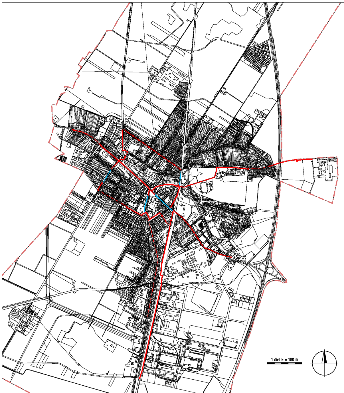
Sieť hlavných cyklistických trás, 2016