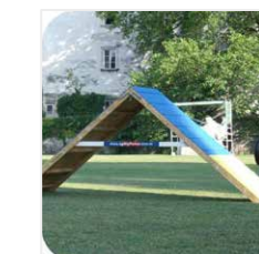
ŠIKMÁ STENA tzv. ÁČKO skladá sa z dvoch plošín vytvárajúcich písmeno A