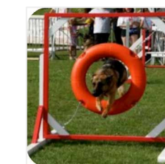
KRUH skok cez kruh ukotvený v stabilnom kovovom ráme