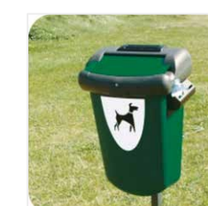
INFOTABULA KOŠ NA PSIE EXKREMENTY OPLOTENIE ZN + PVC