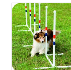
SLALOM pevne fixovaný slalom tvorený ôsmimi kovovými tyčkami výšky 1m