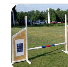
SKOČKA jednoduchá skoková prekážka so štandardnou šírkou 1,5m