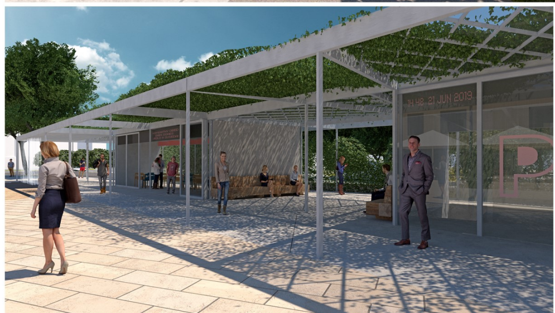
Ilustračné vizualizácie verejných priestorov