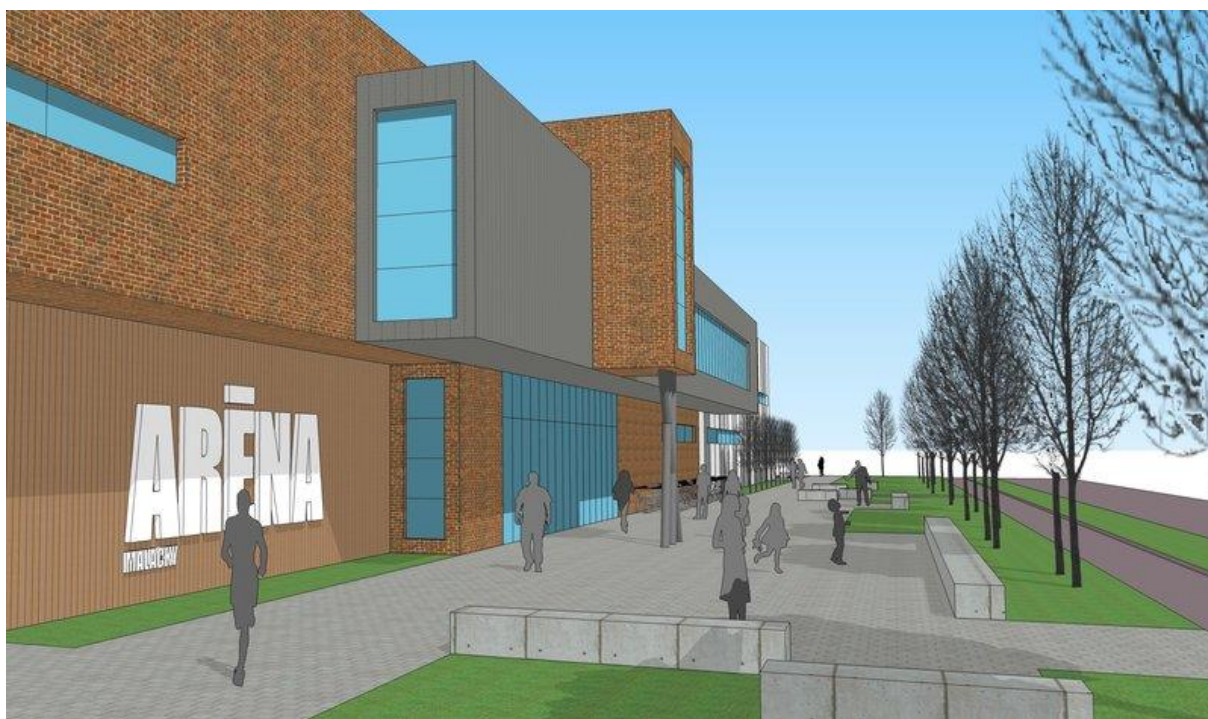
Obr. 1, 2, 3 – Vizuálne znázornenie športového tréningového komplexu.

Športový tréningový komplex by predstavovala dvojpodlažná samostatne stojaca budova o zastavanej ploche cca 4350 m 2 opláštená systémom sendvičových panelov v kombinácii s murovanou časťou. Nosný konštrukčný systém by tvorila kombinácia stenovej konštrukcie a veľkorozponového skeletu.