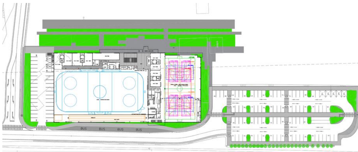
Obr. 4 – Náskres umiestnenia športového tréningového komplexu v areáli Píly.

Medzi hlavné výhody navrhovanej lokality patrí dobrá pešia a cyklistická dostupnosť z oboch strán areálu, dopravné automobilové napojenie na komunikáciu II/503, v budúcnosti aj samostatné napojenie na Pezinskú ulicu. Areál sa nachádza v tesnom dotyku so železničnou a autobusovou stanicou na Nádražnej ulici. Budova komplexu by bola napojená chodníkom na obe plánované parkoviská v areáli (obslužné parkovisko pre 35 vozidiel a záchytné parkovisko pre 89 vozidiel). Zároveň ide o areál, v ktorom by navrhovaná športová činnosť svojou prevádzkou nerušila okolitú zástavbu.