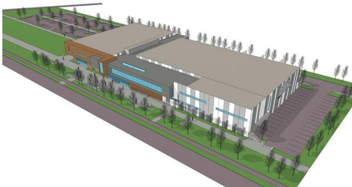
Obr. 5 – Vizualizácia osadenia stavby na pozemku.

Pre umiestnenie navrhovanej činnosti sa vybrala časť areálu Píly, ktorá by spolu so záchytným parkoviskom a obslužnými komunikáciami tvorila kompaktný celok. Návrh je v súlade s funkčnou reguláciou územia podľa územného plánu mesta.