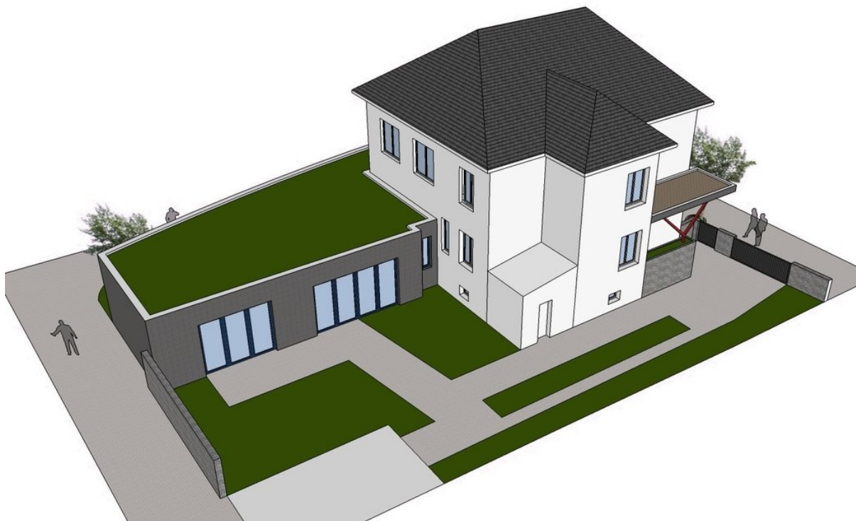
Obrázok 2 – Pohľad z dvora, ktorý sa bude rovnako rekonštruovať.

Okrem stavebnej časti sa budú zakupovať aj prvky vybavenia, ako kuchynská linka so spotrebičmi, jedálenské stoly a stoličky, šatne a lavice pre klientov a zamestnancov, vybavenie na arteterapiu, vybavenie na muzikoterapiu, vybavenie miestnosti na fyzioterapiu, vybavenie oddychovej zóny, nábytok do jednotlivých administratívnych miestností či schodolez.