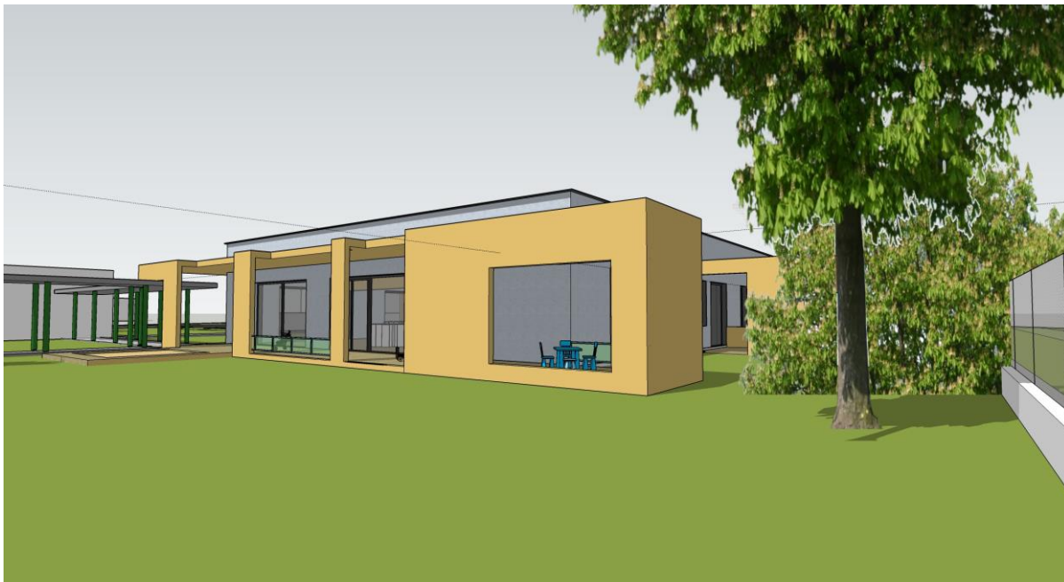
Obrázky 1 a 2: Navrhované architektonické riešenie nového zariadenia.