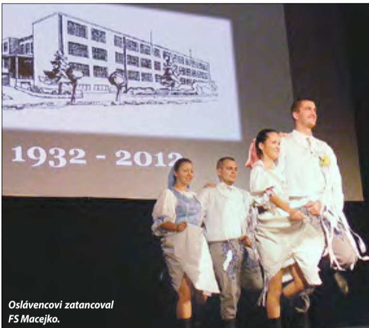
Oslávencovi zatancoval FS Macejko.