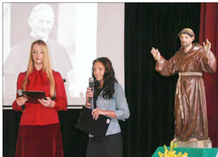
Na oslavy dozeral aj sv. F. Assiský.