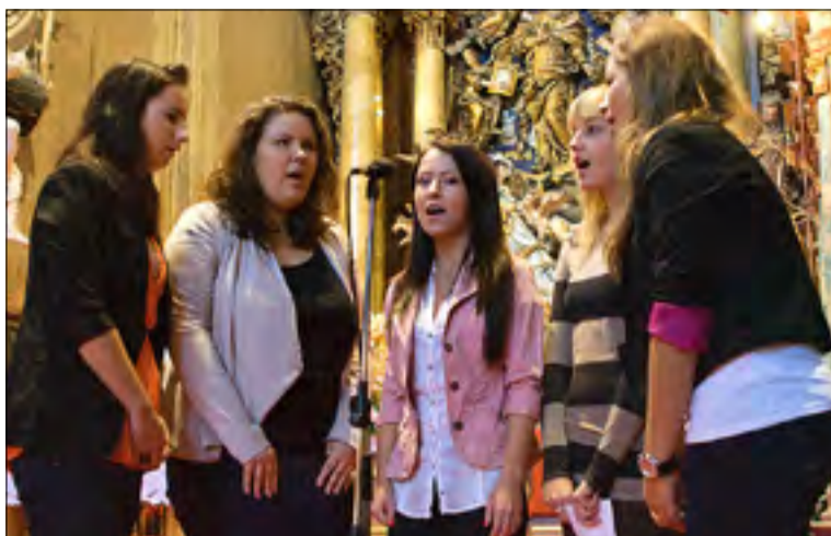
Hudobné talenty Gymnázia Malacky

Školská budova, v tridsiatych rokoch s prívlastkami moderná, reformná s pokusným vyučovaním, prešla za 80 rokov zmenami. Jej bránami prešlo mnoho žiakov, za jej katedry sa postavili stovky učiteľov. Život tejto školy ovplyvnil jestvovanie tisícov obyvateľov nášho mesta. Pripomnutie si 80. výročia otvorenia ZŠ Dr. J. Déreera umožnilo aspoň na chvíľu sa obzrieť či zaspomínať. Slávnostné chvíle umocnila akadémia, ktorá sa