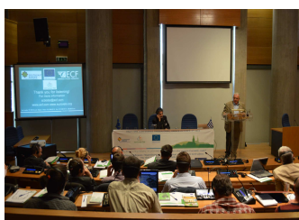
Projektová konferencia "Cesta Železnej opony", Iron Curtain Trail" Thessaloniki, Grécko, 03.10.2013

Projekt je zameraný na rozvoj trasy EuroVelo 13 Cesta Železnej opony v jej južnej časti zo Slovenska až po Čierne more. Viac o projekte na www.ekopolis.sk/ict .